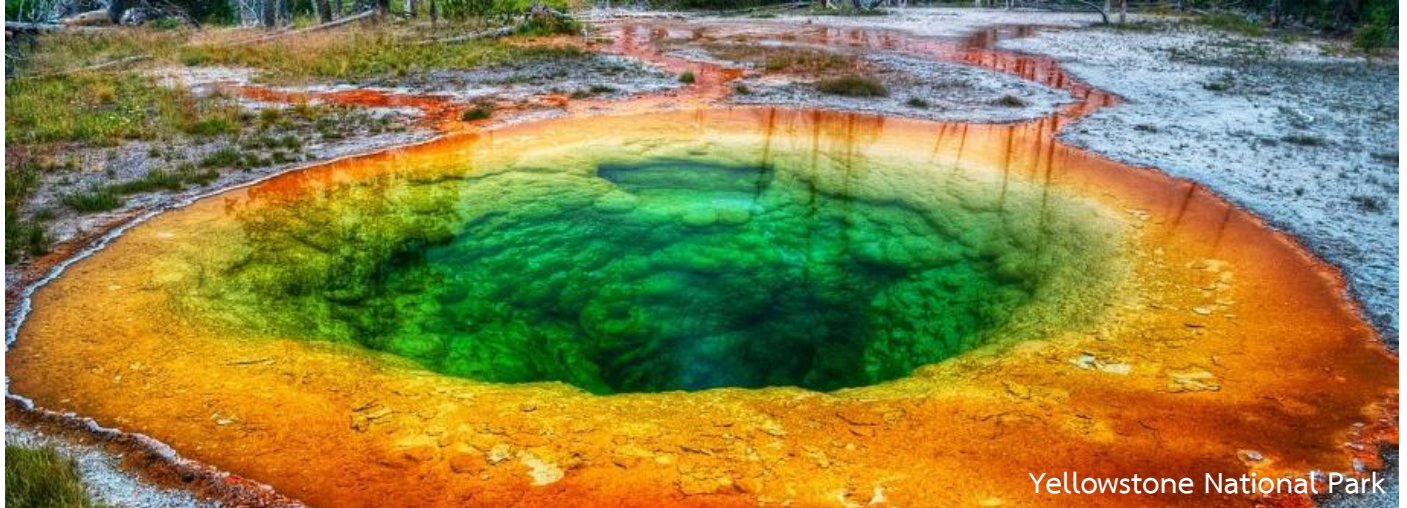
Yellowstone National Park